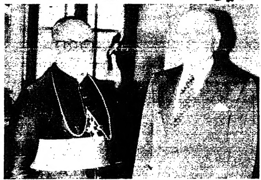
بطريرك خريش أثناء استقباله الرئيس سلام في بكركي امس

كنا ان الل كبر ايضا بان تكون هذه الاحداث التي مورنا بها اخر ما نراه من نوعها ، وان يعود لبنان الى سابق عهده ، لبنان الحية ولبنان التعاون ، ولبنان العزيز المحب للجميع والمفضل عن المبادئ الخيرة والخشي لكل حق ولكل عدل .